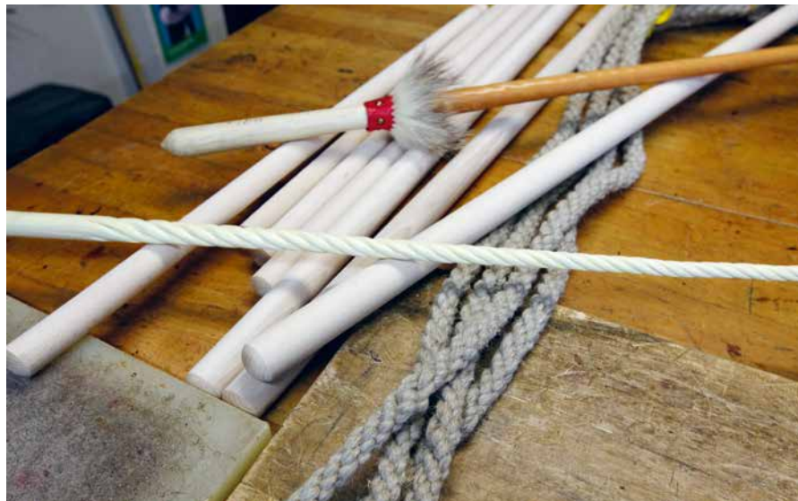
Für die Schafgeissel werden Holzstecken verwendet, während bei der Fuhrmannsgeissel (oben vorne) ein Stab aus gedrehtem Zürgelholz zum Einsatz kommt.

festgebunden. Am vorderen Ende der Schlinge sind Vorschwung und Zwick angebracht.