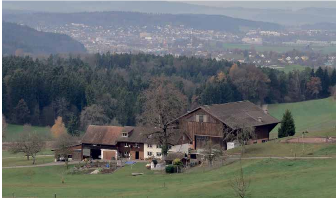
Auf der Anhöhe bietet sich ein prächtiger Blick Richtung Elsau und Winterthur.