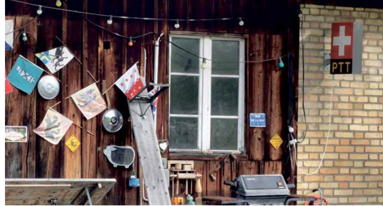
Die Wandergruppe Oetwil am See kommt an der Wirkungsstätte der Köhlerei Andelbach (Bild unten) vorbei und zuvor an einem Hof, der unter anderem mit einem alten PTT-Leuchtschild auffällt.

1876 soll ein Grossbrand das halbe Städtchen zerstört haben, vernehmen wir von Théo Seeholzer. Unser Weg führt uns der noch jungen Eulach entlang am Rande einer neueren Siedlung zum Dorfausgang. Noch selten sind wir einem höheren und akkurater geschnittenen Thujahag begegnet. Schon bald sind wir am Waldrand, stellen fest, dass heute auch Jäger auf den Beinen sind. Nun sind wir mitten in dem von Seeholzer angedrohten «langen, aber moderaten» Anstieg zum «Heidenbühl». Lang schon, aber moderat nicht, ist von Einzelnen aus der Gruppe zu hören.