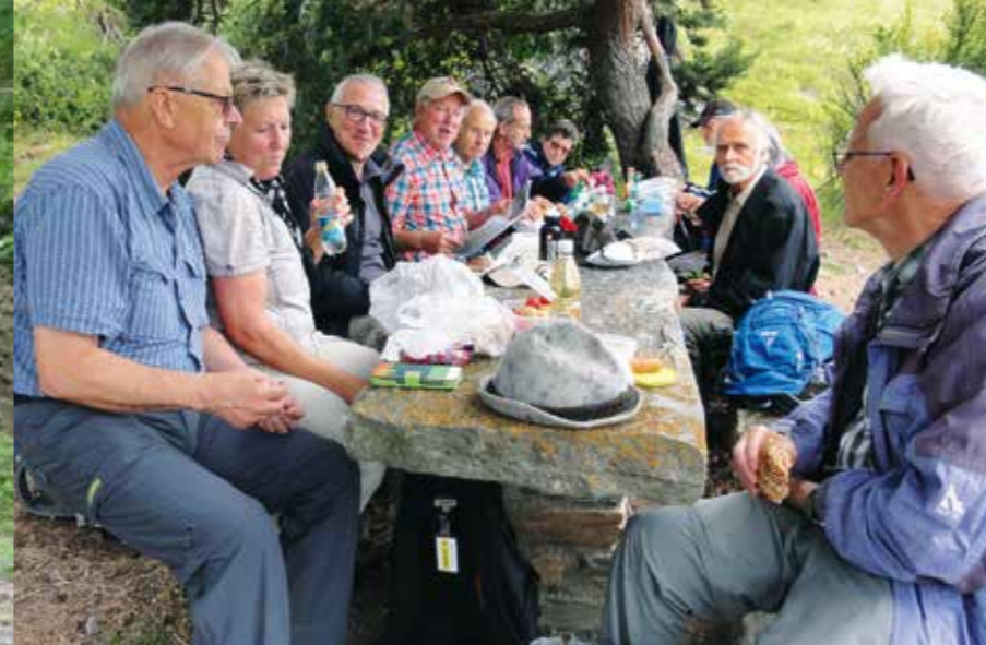
Auf dem «Riedgarten» (Bild oben) stärken wir uns, bevor der weitere Verlauf der Wanderung Abenteuerliches und Gewagtes für uns bereithält.

Der schmale Pfad entlang der Wasserleitung ist zwar reizvoll, aber verlangt ziemliche Konzentration. Zum einen sind die Steine am Morgen noch feucht und deshalb rutschig. Zum anderen müssen wir immer wieder teilweise schmalste Passagen begehen – zu unserer rechten Hand die Felsen und die Suone, zu unserer linken Hand der steile Abhang. Immerhin sind die Wege mit Handläufen und Seilen gut gesichert. Die Vegetation ist beein-