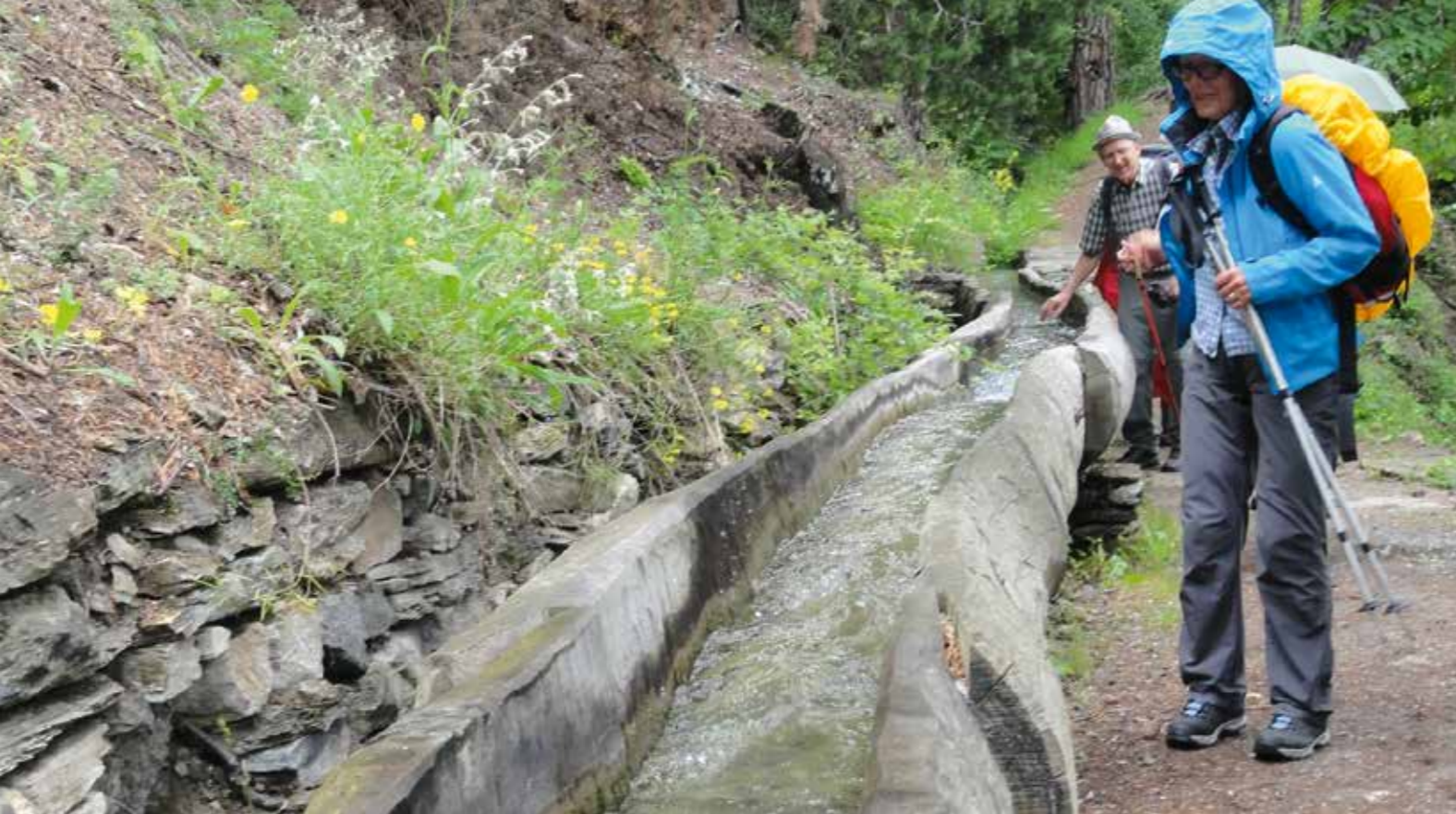
Die Suonen dienen heutzutage zunehmend auch touristischen Zwecken. Zur Freude der Wanderer.